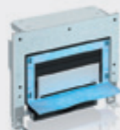
Montážní prvek Uniflex pro sprchy s odtokem ve stěně pro zděné konstrukce

→ součástí dodávky je opláštění seříznuté na přesný rozměr