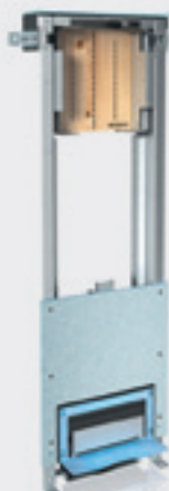
Montážní prvek Uniflex pro sprchy s odtokem ve stěně pro zděné konstrukce

Použití: pro zabudování do snížené stěny nebo do stěny na celou výšku místnosti prováděnou suchým procesem